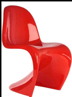
Krzesło Panton

Panton inaczej niż pozostali duńscy projektanci był rewolucjonistą, a nie ewolucjonistą. W trakcie swojej kariery tworzył z wykorzystaniem nowoczesnych materiałów śmiałe, kolorowe, zabawne projekty będące odzwierciedleniem jego optymistycznego nastawienia do przyszłości.