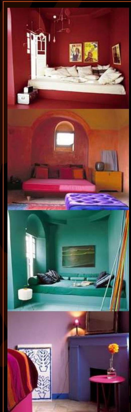
Barwy we wnętrzach; Źródło: Internet

Opracowano na podstawie „Jak dobrać kolory. Inspirujące palety barw do projektowania wnętrz.” Anna Starmar, ARKADY