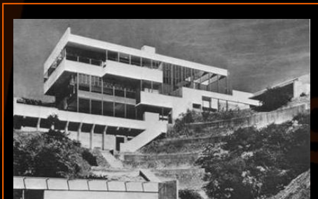
Lovell House

W ostatnich latach we wzornictwie można zauważyć powrót do estetyki racjonalnej. Producenci poszukują bowiem rozwiązań międzykulturowych i uniwersalnych, charakterystycznych dla stylu międzynarodowego.