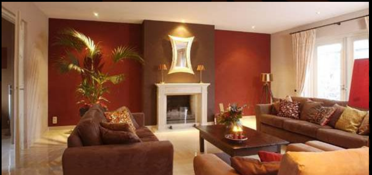
Wnętrze jesienne