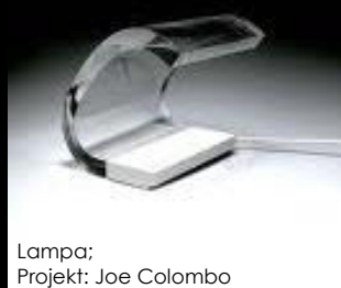
Lampa; Projekt: Joe Colombo

Colombo był autorem wielu nowatorskich projektów mebli, oświetlenia, naczyń szklanych, klamek, fajek, budzików i zegarków. Od samego początku swej kariery interesował się systemami zagospodarowania mieszkań. Fascynacja ta doprowadziła do powstania krzesła Tube i Multi, które można było ze sobą dowolnie zestawiać, tworząc za każdym razem inny system wypoczynkowy, co odzwierciedlało główny cel projektów, które powinny dać się przystosować do różnych warunków i potrzeb.