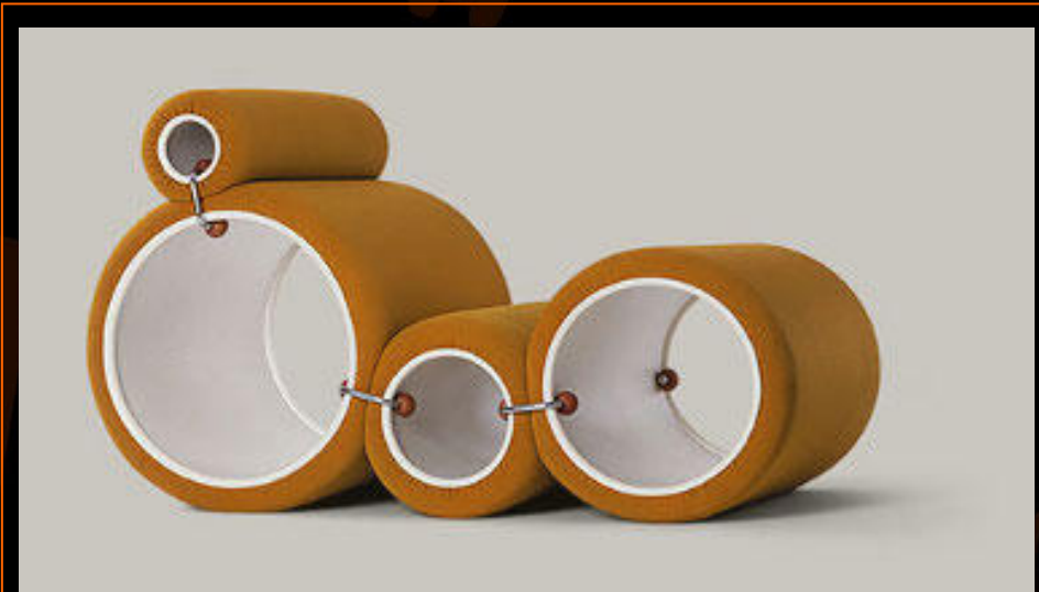
Projekt: Joe Colombo

klamek, fajek, budzików i zegarków. Od samego początku swej kariery interesował się systemami zagospodarowania mieszkań. Fascynacja ta doprowadziła do powstania krzesła Tube i Multi, które można było ze sobą dowolnie zestawiać, tworząc za każdym razem inny system wypoczynkowy, co odzwierciedlało główny cel projektów, które powinny dać się przystosować do różnych warunków i potrzeb. Jednak jego najbardziej śmiałe projekty, to zintegrowane mikroprzestrzenie. Visiona, jednostka mieszkalna przyszłości pokazana na wystawie Visiona firmy Bayer, kryła meble będące jednocześnie elementami strukturalnymi i na odwrót. Colombo projektował dla firm O-Luce, Kartell, Bieffe, Alessi, Flexform i Boffi. Jego wspaniale rozwijającą się karierę przerwała nagła śmierć. Colombo miał wtedy 41 lat.