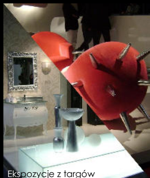
Ekspozycje z targów

W kwietniu odbyły się w Mediolanie coroczne targi mebli i wyposażenia wnętrz. Targi te należą do największych na świecie. Design prezentowany w Mediolanie wyznacza trendy w meblarstwie i dekoratorstwie nie tylko w Europie, ale i na innych kontynentach.