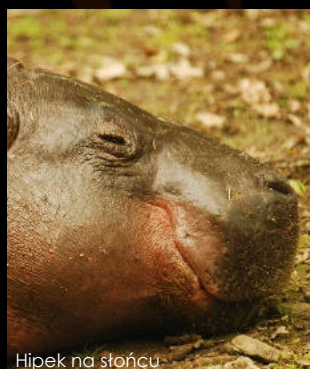
Hipek na słońcu

Pancernik włochaty ma się dobrze, inne zwierzęki z opolskiego ZOO zajmują się potomkami lub wygrzewają w promieniach wiosennego słońca :)