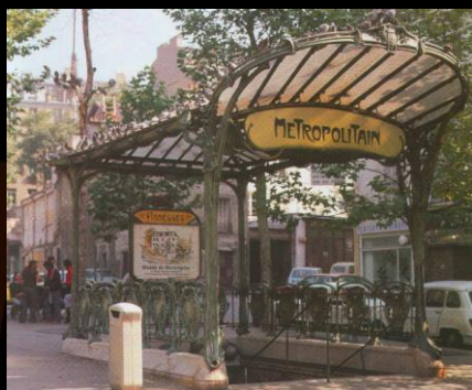
Wejście do paryskiego metra

Art Nouveau, z uwagi na całkowite odrzucenie stylów przeszłych, można uznać za pierwszy, prawdziwie nowoczesny styl międzynarodowy. Jednak poprzez rozbudowaną ornamentykę był on nierozdzielnie związany z dekadencją fin-de-siècle, co spowodowało, że wraz z