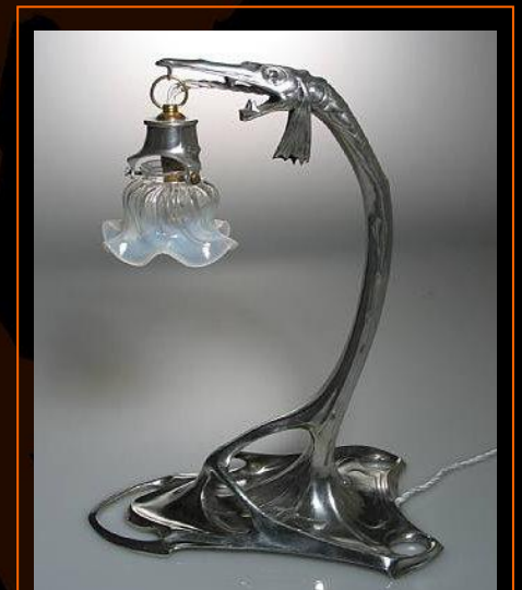
Lampa; Projekt: Friedrich Adler

nadejściem XX wieku zdominowany został przez estetykę maszyn i awangardowe, proste formy geometryczne lepiej spełniające wymogi seryjnej produkcji.