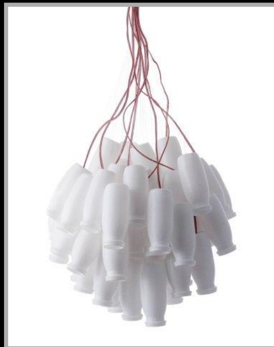
Lampa „Produkt mleczny”

Na szczególną uwagę zasługuje lampa „Produkt mleczny”. Zaprojektowana przez polskich projektantów z pracowni DBWT, była pokazywana na wystawach w: Warszawie, Brukseli, Berlinie i Londynie.